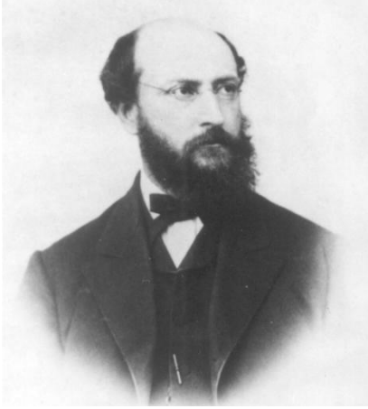
Benjamin Apthorp Gould (Cuadro existente en el Museo B. Gould)

Tierra desde el centro del Sol. Con este valor y el radio ecuatorial terrestre es posible obtener la distancia que nos separa del Sol por simples relaciones trigonométricas. A su vez, con esta distancia pueden calcularse con facilidad las restantes dimensiones del Sistema Solar.