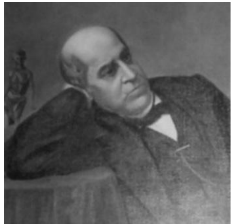
Domingo Faustino Sarmiento ( Detalle cuadro existente en el Cabildo Histórico de Córdoba )

Sin embargo, la iniciativa se ve frustrada circunstancialmente por la carta del 11 de enero de 1866 del Ministro de Justicia, Culto e Instrucción Pública, Dr. Eduardo Costa; imponiéndole de la imposibilidad de llevar adelante los planes en tal sentido, apoyados fervientemente por el representante argentino, por razones de índole económica, derivadas de